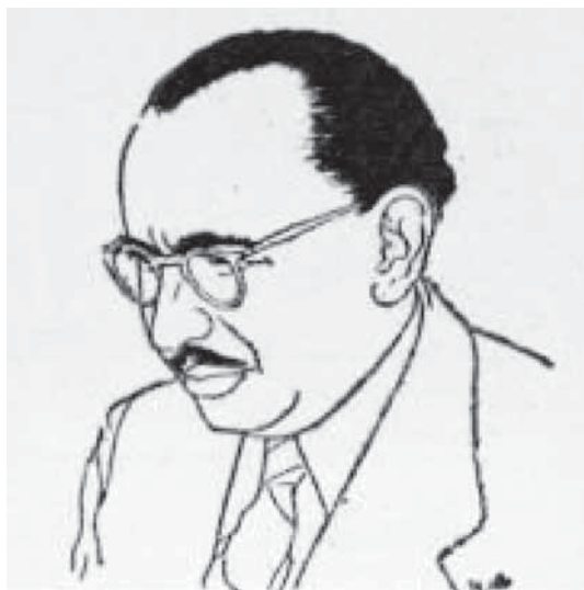
Enrique Espinoza. "Libros y revistas". Colección Fotográfica Biblioteca Nacional. Chile.