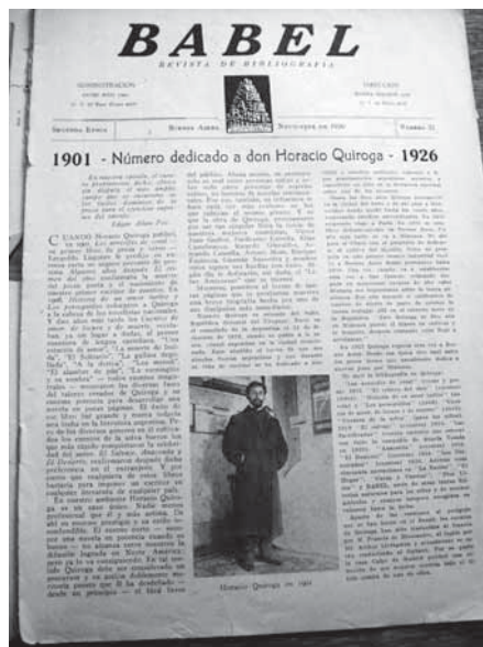
Revista Babel . Revista de bibliografía. Nº 21, noviembre 1926. CEDINCI, Argentina.